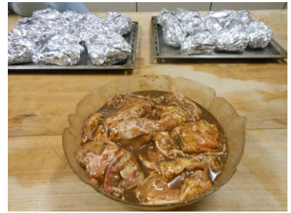
Voici les préparations terminées

Après toutes ces préparations un groupe s'installe dans le salon pour regarder le foot à la télévision